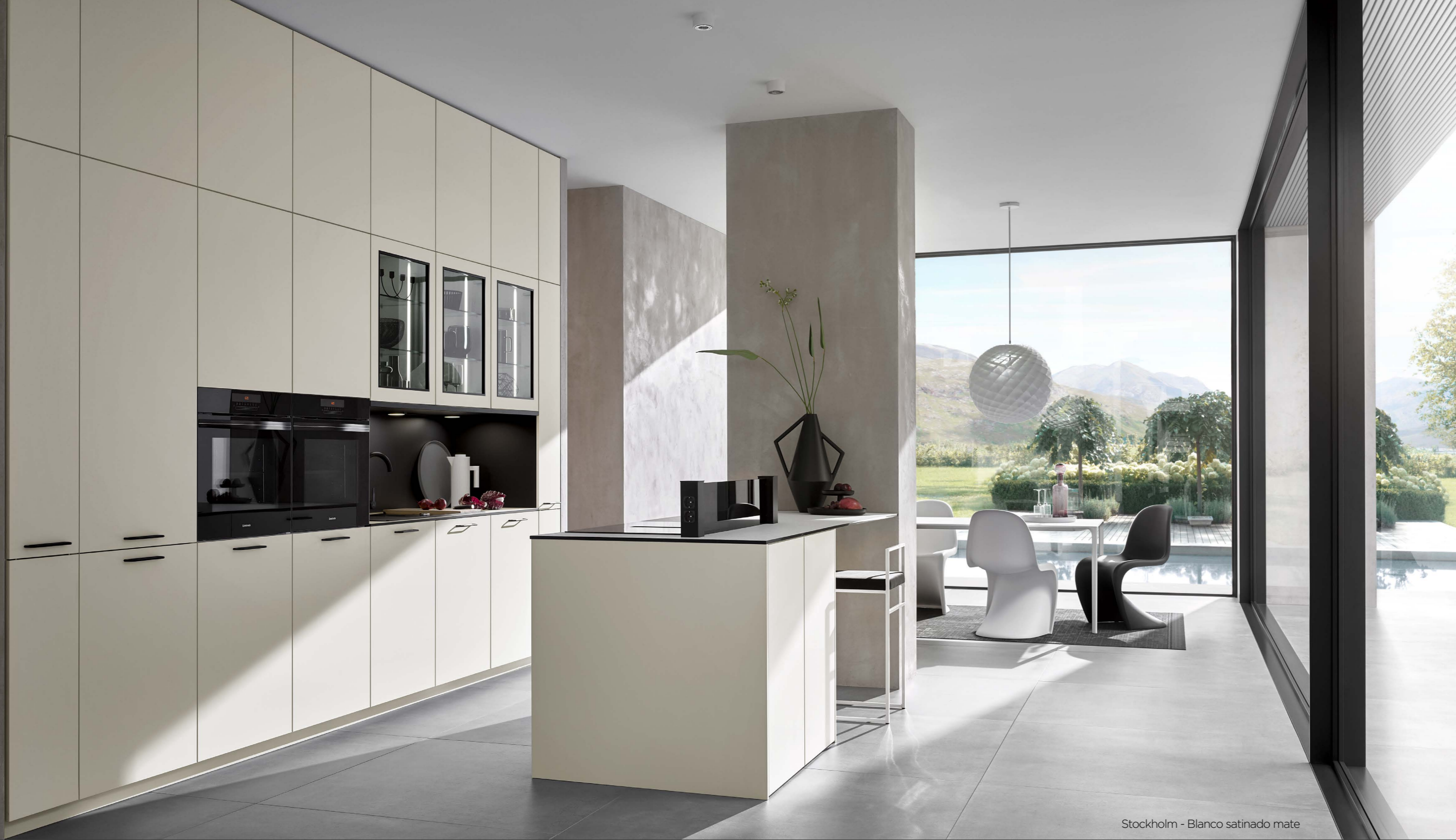
Stockholm - Blanco satinado mate